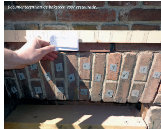
Documenteren van de baksteen voor restauratie.