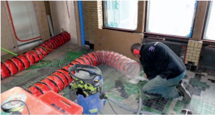
Verwijderen en herplaatsen van de gedocumenteerde granivertegels.

tegeltje is nagedacht, ligging, schuining, kleur, glans. Dus zijn de vloeren gefotografeerd en gedocumenteerd en heeft herstel uiterst zorgvuldig, steentje voor steentje, plaatsgevonden. Er was een speciale commissie ingesteld, met daarin restauratiedeskundigen vanuit diverse instanties, om op belangrijke momenten tijdens het bouwproces tot historische verantwoorde keuzes te komen. Alle vaklieden voelden dat hier sprake was van een bijzonder project. Dat zij betrokken waren bij een totaalkunstwerk, dat tot in de puntjes precies terug gerestaureerd moest worden naar 1920".