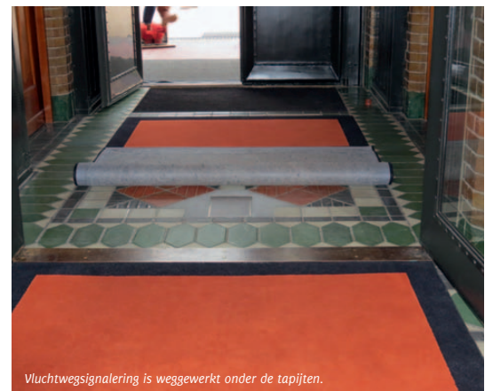
Vluchtwegsignalering is weggewerkt onder de tapijten.