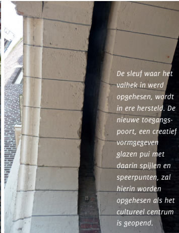
De sleuf waar het valhek in werd opgehesen, wordt in ere hersteld. De nieuwe toegangspoort, een creatief vormgegeven glazen pui met daarin spijlen en speerpunten, zal hierin worden opgehesen als het cultureel centrum is geopend.