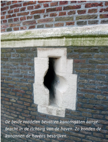
De beide rondelen bevatten kanongaten aangebracht in de richting van de haven. Zo konden de kanonnen de havens bestrijken.