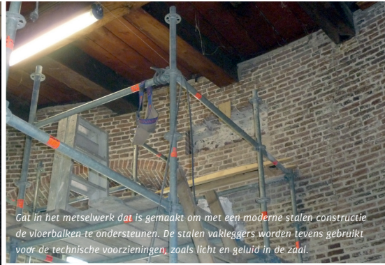
Gat in het metselwerk dat is gemaakt om met een moderne stalen constructie de vloerbalken te ondersteunen. De stalen varleggers worden tevens gebruikt voor de technische voorzieningen, zoals licht en geluid in de zaal.